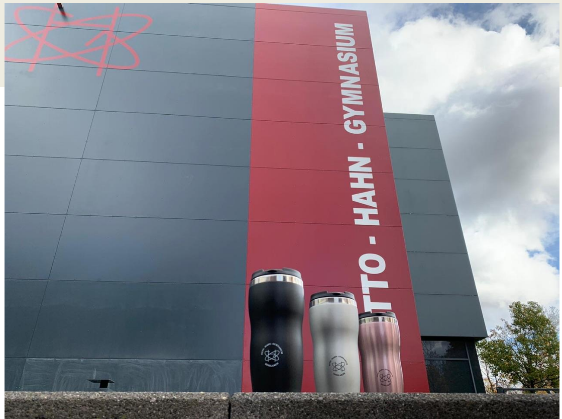
Start der Schülerfirma: Produkte mit OHG-Logo